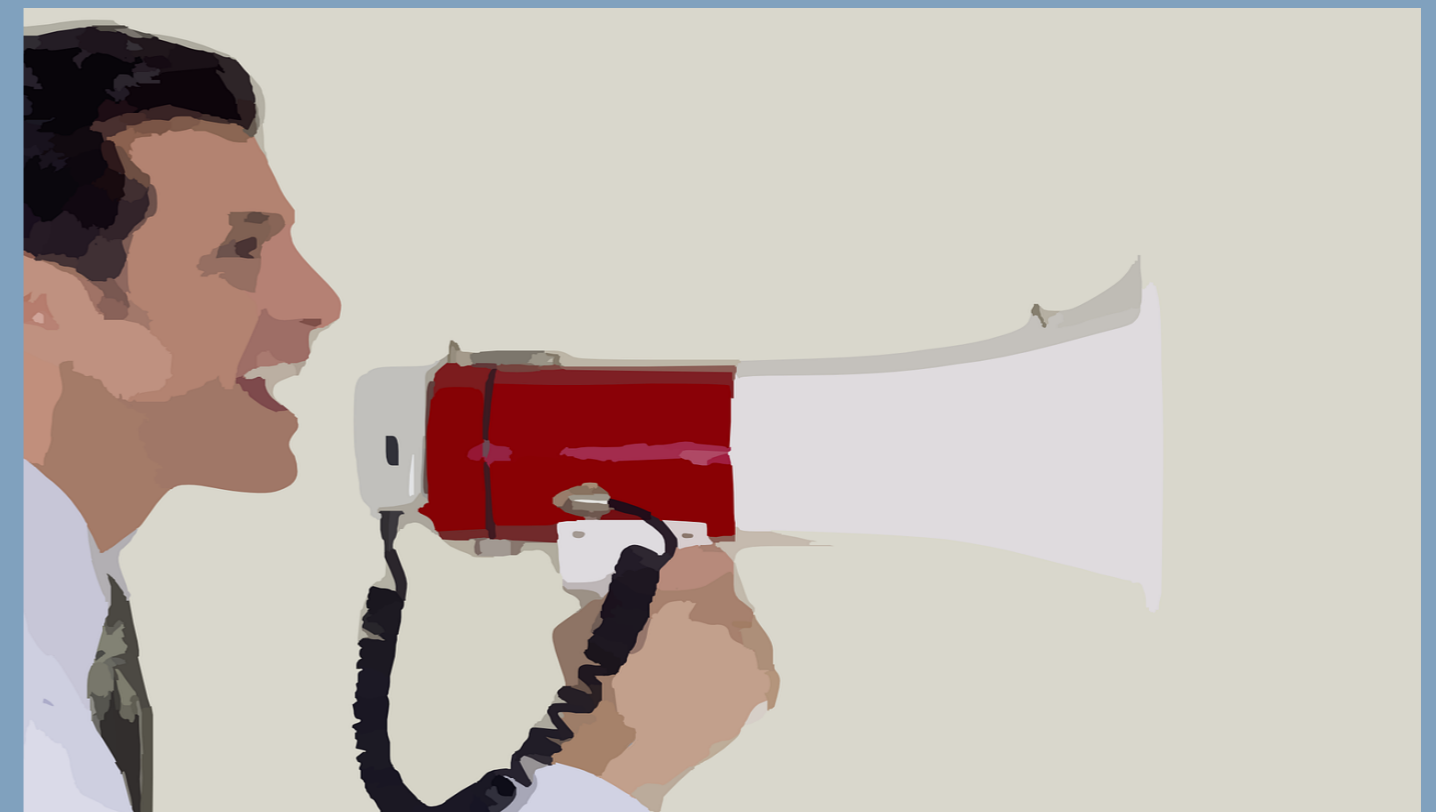
Table ronde: Protection des lanceurs d'alerte – perspectives

Restaurant Veranda Schanzeneckstrasse 25, 3012 Bern